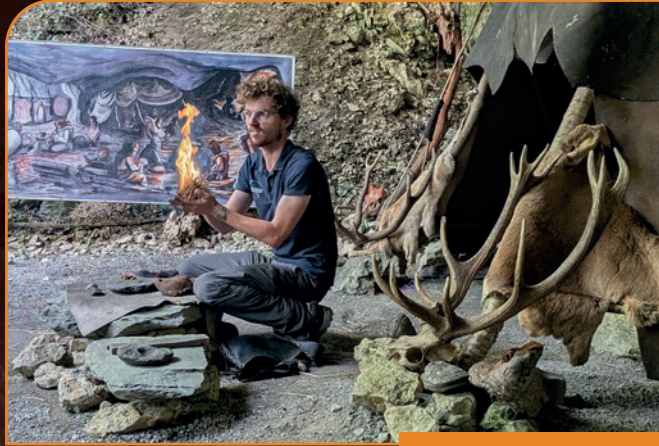
Le feu préhistorique